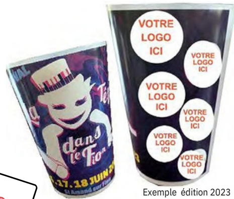
Exemple édition 2023