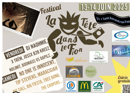
Exemple édition 2025

Offre limitée à 20 partenaires – sous réserve de réunir assez de partenaires.